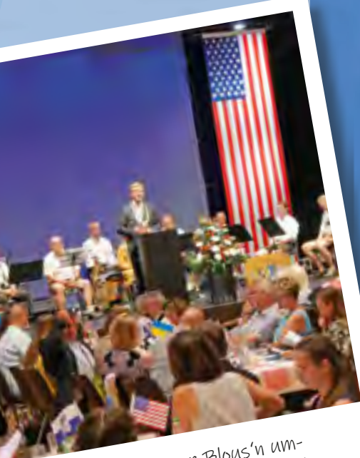
Die Gunzenhäuser Blous'n umrahmte den Festakt musikalisch