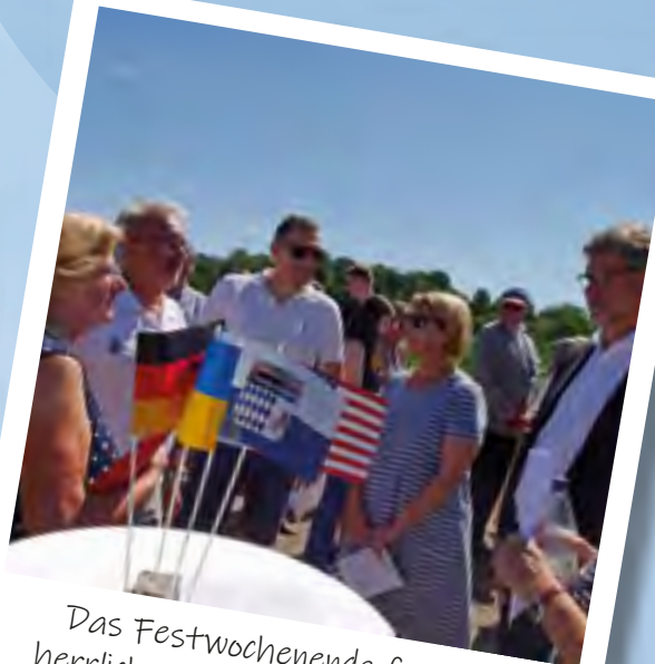
Das Festwochenende fand bei herrlichem Sommerwetter statt

net. Im Gegenzug durften wir während des Bürgerfests in unserer Stadt eine offizielle Delegation aus Amerika begrüßen. Neben einem Festgottesdienst und der Übergabe einer Streuobstwiese, wurde die 60-jährige Freundschaft im Rahmen eines großen Festakts in der Stadthalle ausgiebig gefeiert.