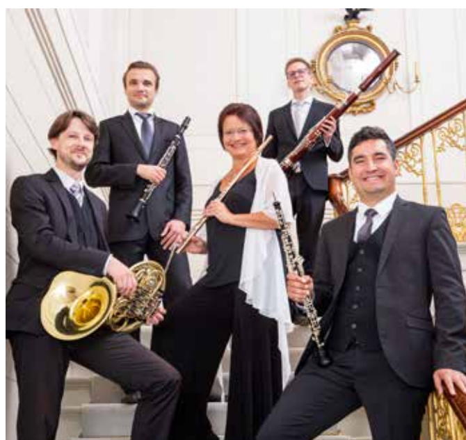
Mit einem Auftritt des Hamburger Bläserquintetts startet die Gunzenhäuser Konzertreihe in die Saison 2022/2023.

einem ICMA-Award ausgezeichnet und gilt in Fachkreisen als „die neue Referenz für dieses Repertoire“. Mit seinem Ensemble „The Gentleman’s Flute“ bringt er die Dynamik und die Klangfarben des Barocks in die Konzertsäle dieser Welt.