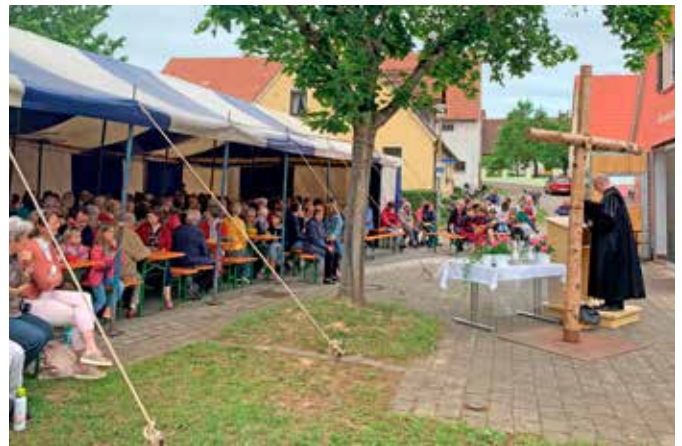
Das traditionsreiche Himmelfahrtsfest wurde mit einem Gottesdienst eröffnet.

und entlohnt wurde der Fleiß der vielen Künstlerinnen und Künstler mit kleinen Präsenten. Alle Kunstwerke wurden anschließend aufgehängt und konnten von den Festbesuchern bestaunt werden.