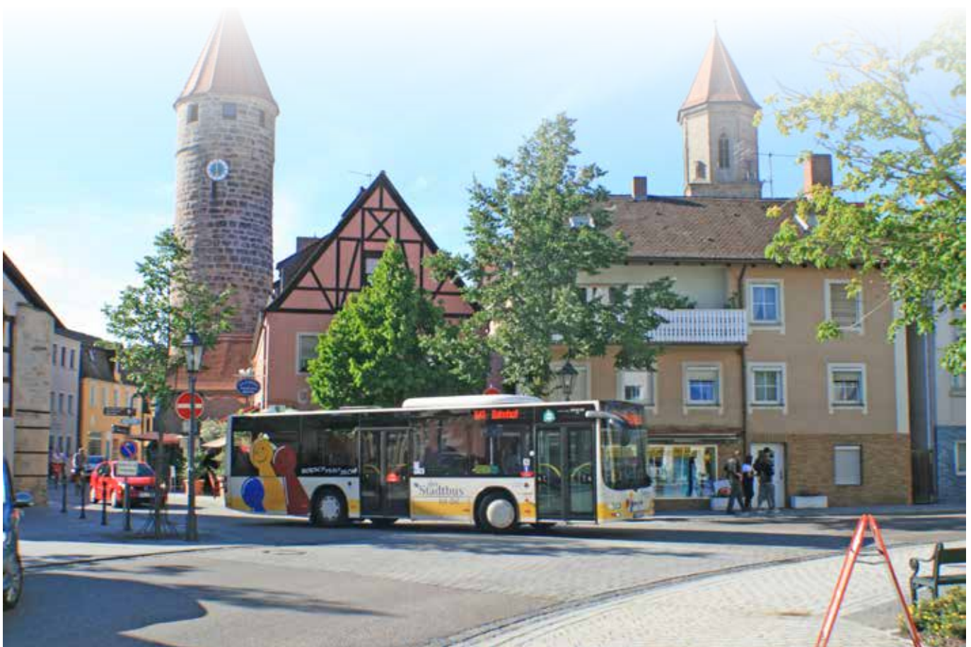
Ein funktionierender Öffentlicher Personennahverkehr gehört zu den Bausteinen der Energie- und Verkehrswende.