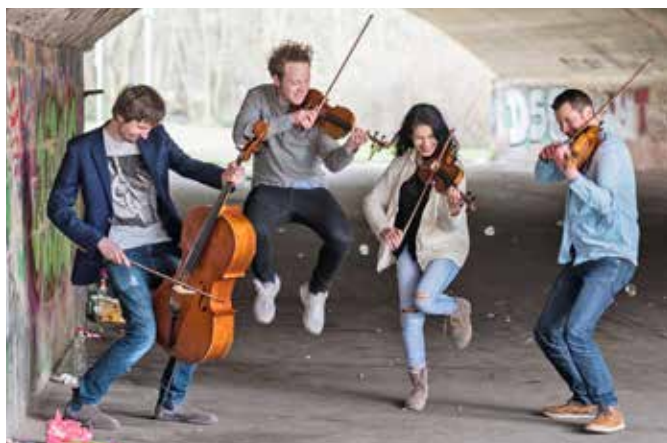
Das Feuerbach Quartett interpretiert Kammermusik auf moderne Art und Weise.

Die Veranstaltungen der kleinKUNSTbühne beginnen jeweils um 19 Uhr, eingelassen in den Falkengarten wird um 18 Uhr. Es handelt sich um Open-Airs, die 20 Euro pro Person ab einem Alter von 15 Jahren kosten. Von 7 bis 14 Jahre fallen