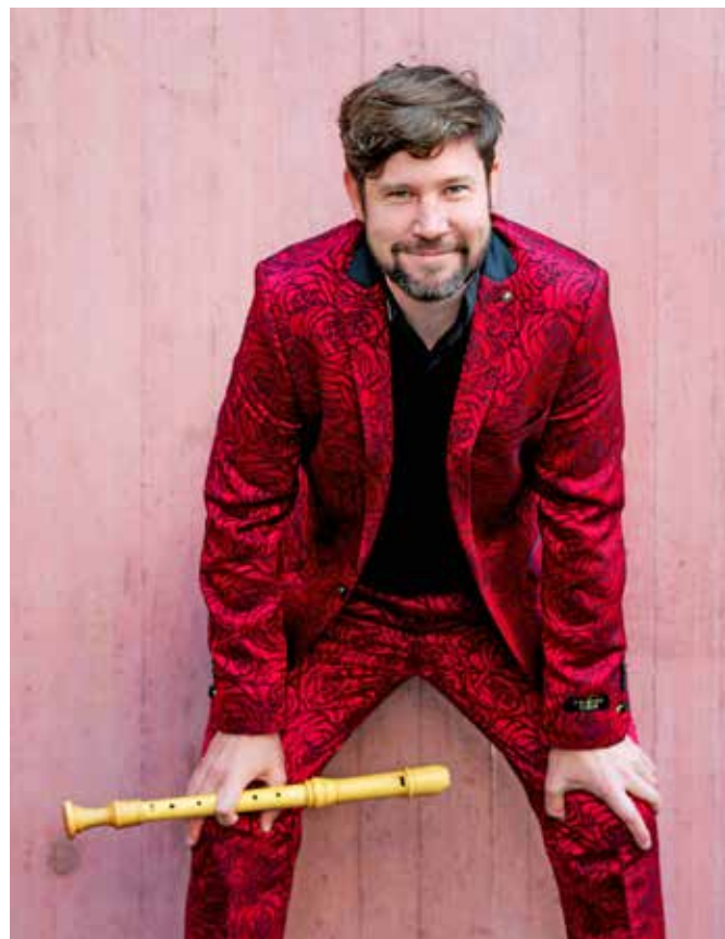
Stefan Temmingh bringt die Klangfarben des Barock in die Konzertsäle dieser Welt.

Den Abschluss der 2. Gunzenhäuser Konzertreihe machen am 30. April 2023 die Barockmusiker von „The Gentleman’s Flute“. Frontmusiker und Blockflötenkünstler Stefan Temmingh wurde 2018 mit