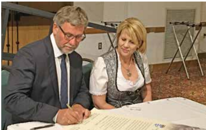
Die beiden Bürgermeister beim Unterzeichnen der Partnerschaftsurkunde.