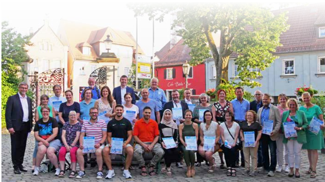
Die teilnehmenden Unternehmen kommen aus allen Branchen. Hier freuen sich die Ausgezeichneten vor dem Haus des Gastes über die Zertifizierung.

Bei Interesse und für Fragen rund um die Zertifizierung stehen Ihnen die Mitarbeiterinnen und Mitarbeiter der städtischen Wirtschaftsförderung unter Tel. 09831/508-131 per per E-Mail an wifoe@gunzenhausen.de gerne zur Verfügung.