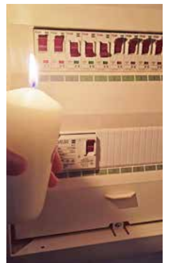
Manchmal kann ein Stromausfall mehrere Stunden dauern. Dann sollten beispielsweise Kerzen zur Hand sein.

Schließlich sollte an eine Bargeldreserve gedacht werden, denn bei Stromausfall funktionieren auch Geldautomaten nicht mehr. Für weitere Tipps im Krisenfall und in Notsituationen empfehlen wir die Internetseite des Bundesamts für Bevölkerungsschutz und Katastrophenhilfe unter www.bbk.bund.de .